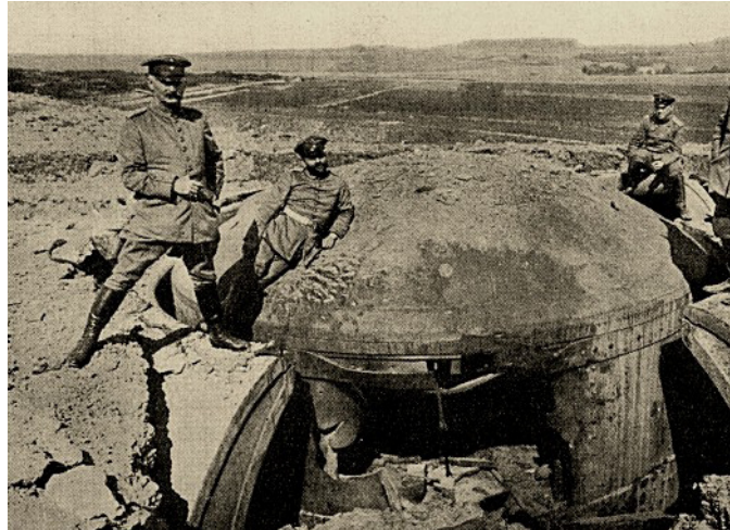
Een verwoeste koepel van het fort kort na de inval van de Duitse troepen in 1914