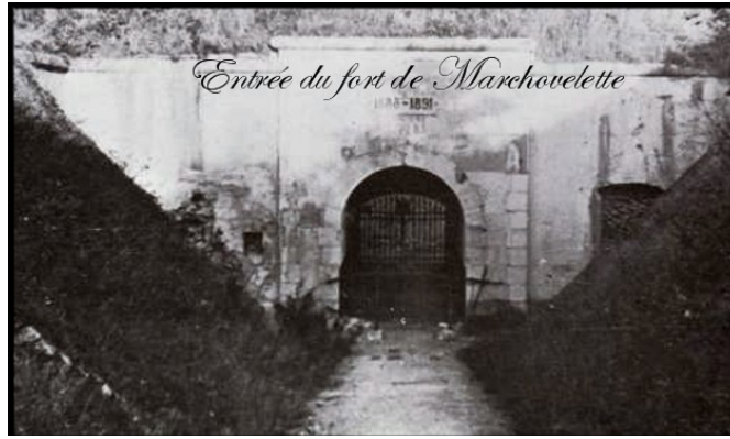
De ingang van het fort van Marchevelette